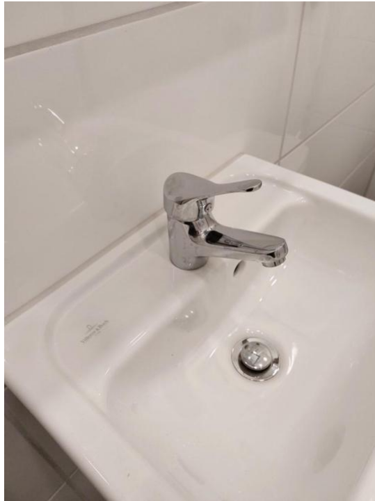
baden und pflegen