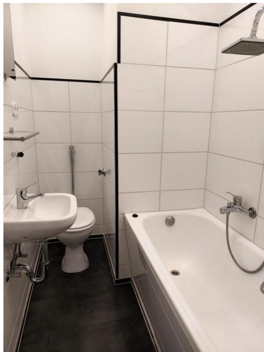
baden und pflegen