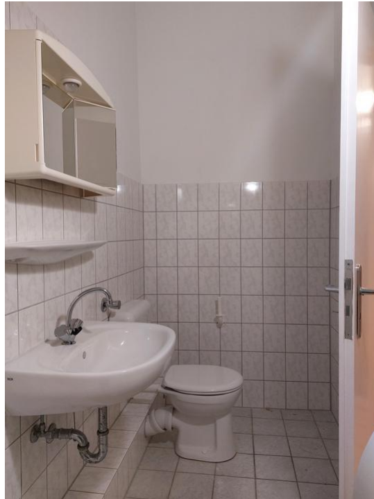
duschen und pflegen