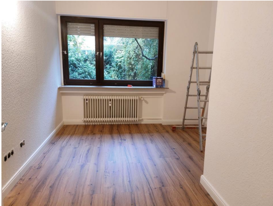
wohnen und schlafen