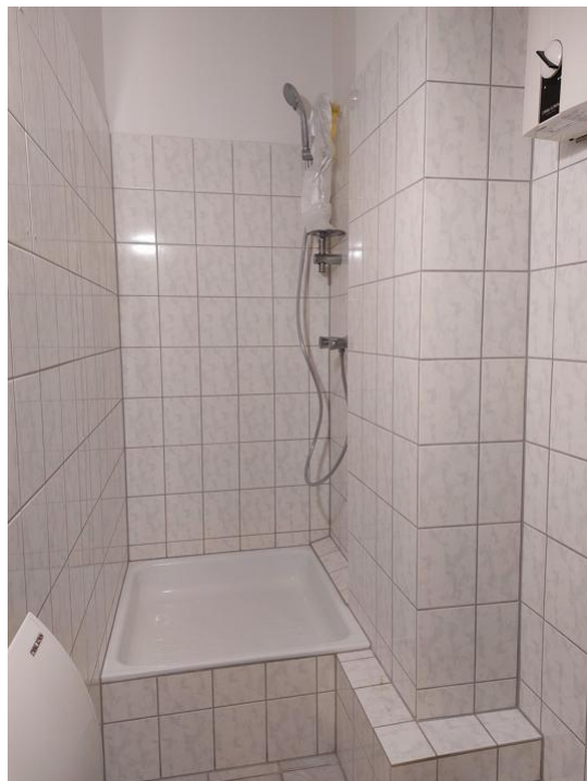
duschen und pflegen