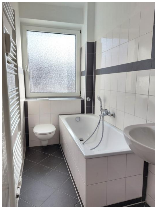
baden und pflegen