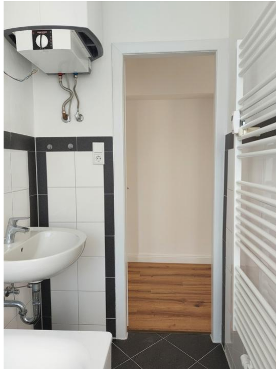
baden und pflegen