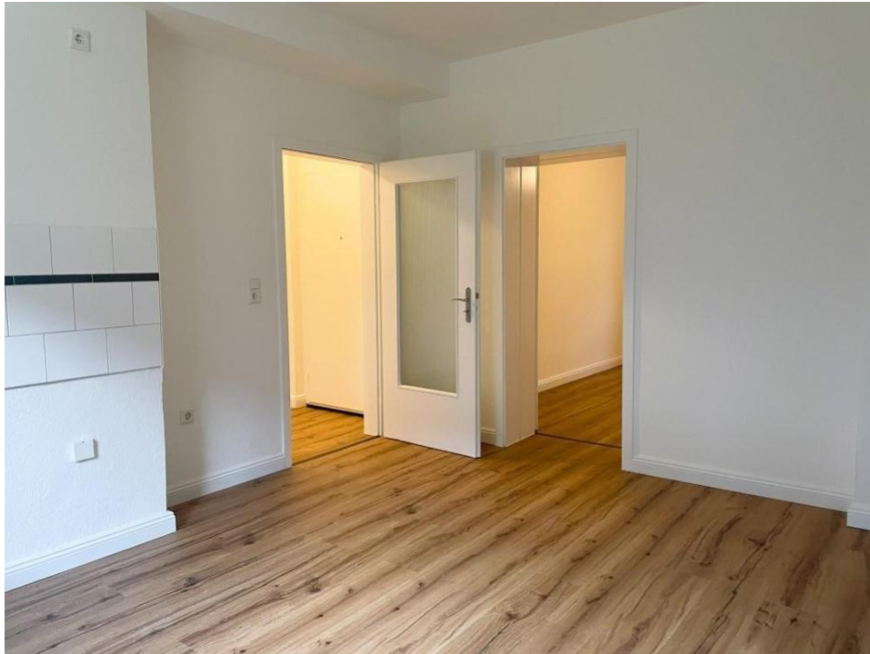
wohnen und kochen