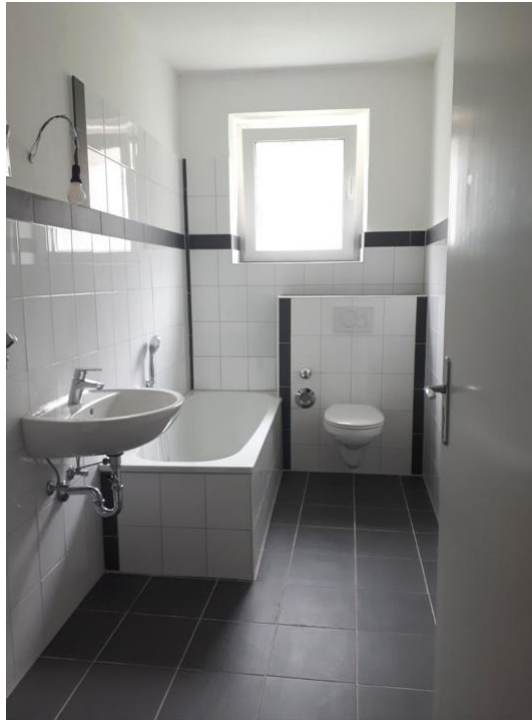
baden und pflegen