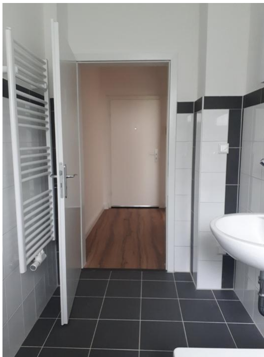
baden und pflegen