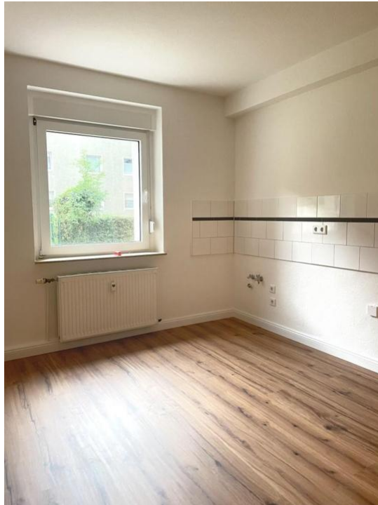
wohnen und kochen