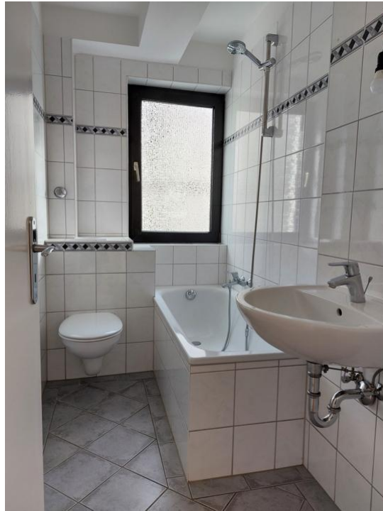
baden und pflegen