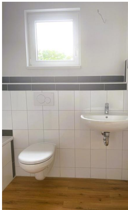
baden und pflegen