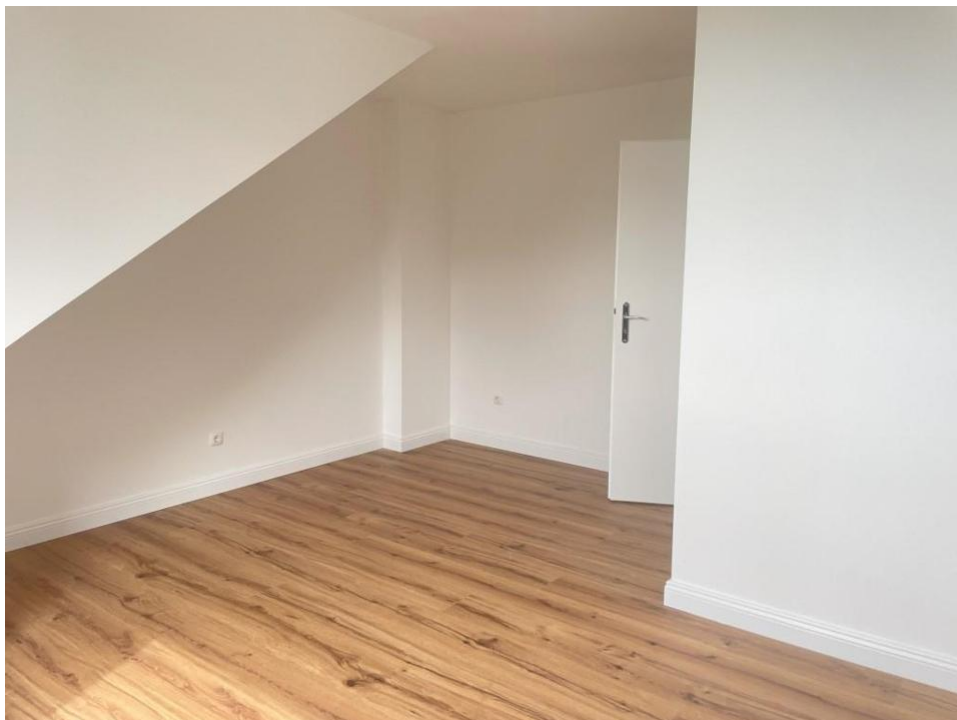
spielen, arbeiten oder ankleiden