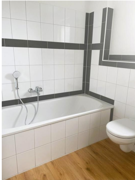
baden und pflegen