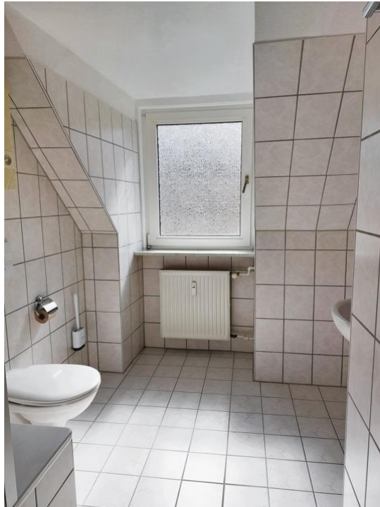
baden und pflegen