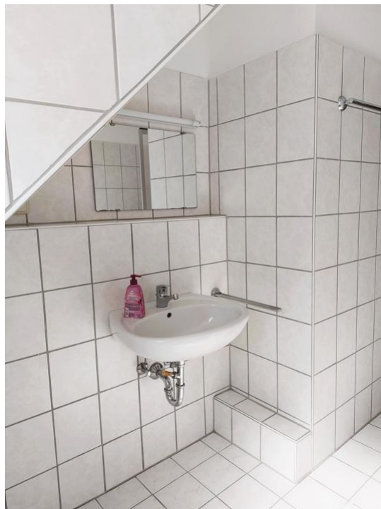
baden und pflegen