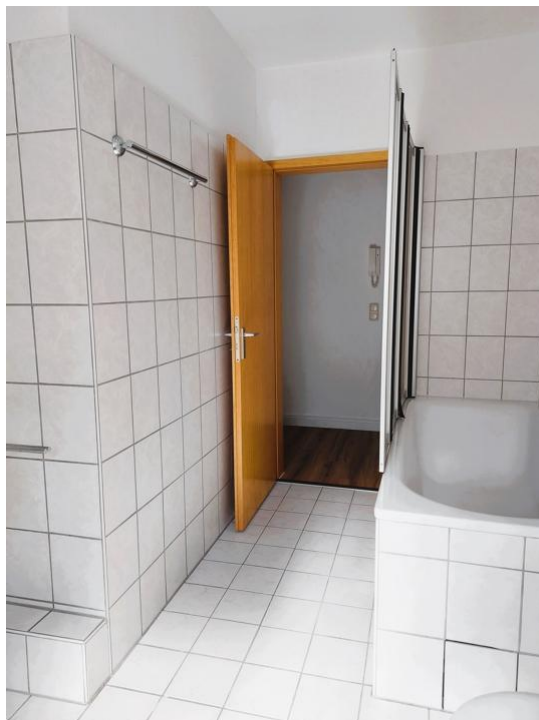
baden und pflegen