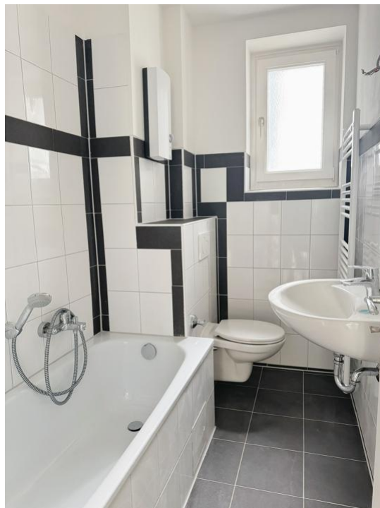
baden und pflegen