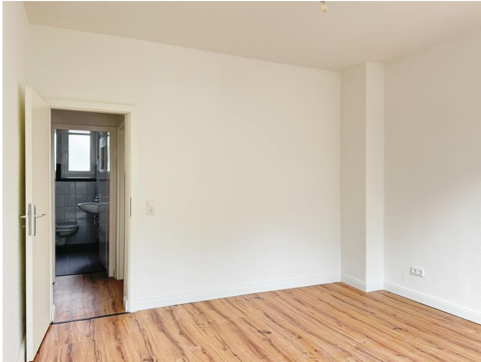
wohnen und schlafen