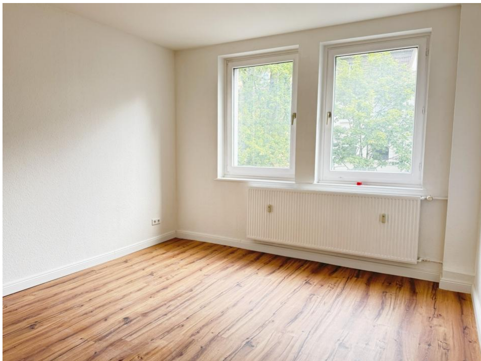
wohnen und schlafen